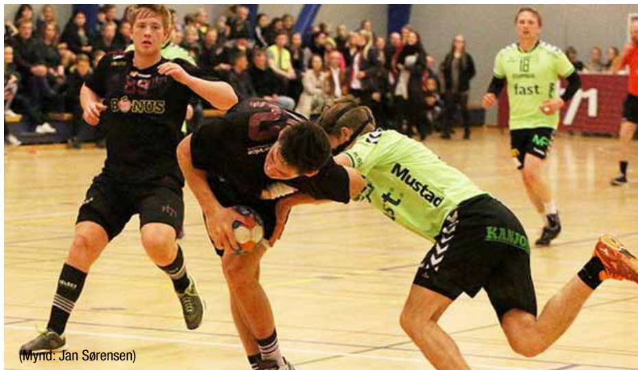
H71 og Team Klaksvík í dysti í Hoyvíkshøllini fyri hálvumsjeynda ári síðani

Team Klaksvík hevur næstan øll árin í bestu deildini havt smalan hóp.