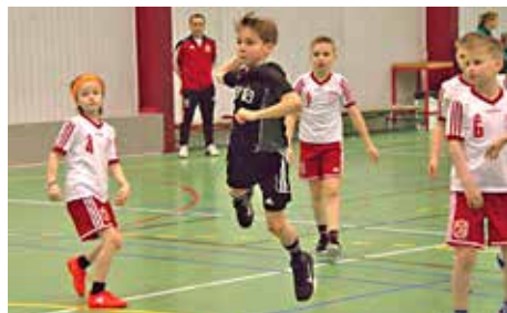
Venjarafraðgreiðing D10 á síðu 26