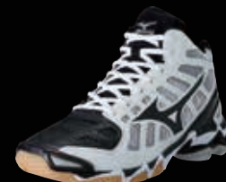
Wave Lightning RX2 MID