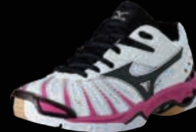
WAVE STEALTH 2