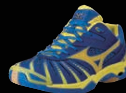
WAVE STEALTH 2