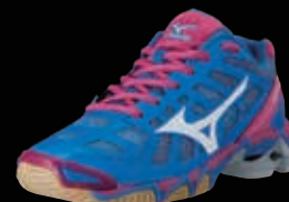
Wave Lightning RX2