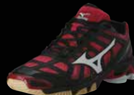
Wave Lightning RX2